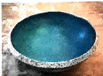
Pocillo chico ø 13 x 4 cms Cant. 56 Peso unit. 320 gr Peso total 17.920 kgs