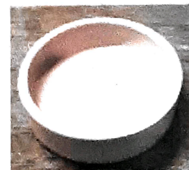
Pocillo chico ø 9x 2.5 cms Cant. 56 Peso unit. 220 gr Peso total 12.320 kgs