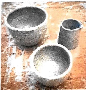
20 Tazas gr. peso total 6 kg 08 Tazs ch. peso total 1.440 kg 20 Jarritas ch. peso total 2.400 kg