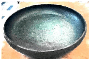
Plato semi hondo ø 23.5 x 4.5 cms Cant. 80 Peso unit. 900 gr Peso total 72 kgs