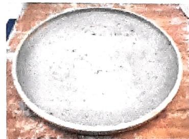
Plato plano gr ø 26 cms Cant. 80 Peso unit. 1.250gr Peso total 100 kgs